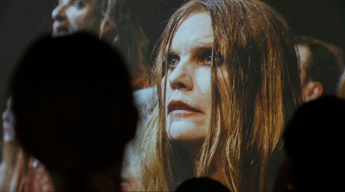
Stillbild från Requiem SHM 24217 (2023)