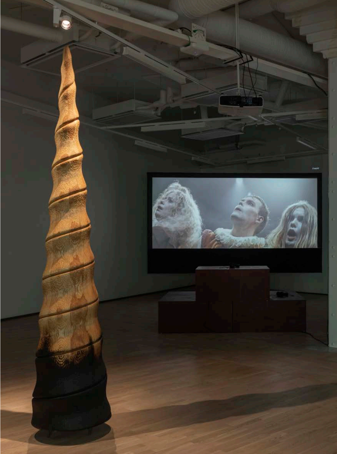
Wet Wand for Future Fires (2023) & Requiem SHM 24217 (2023)