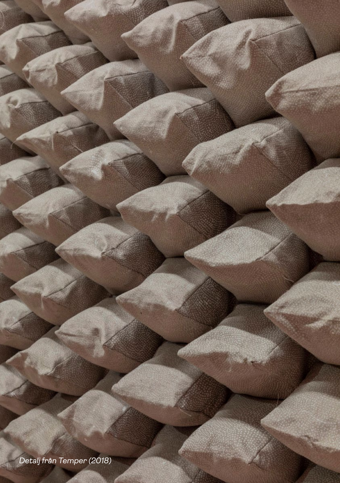
Detalj från Temper (2018)

Ett annat verk som hanterar relationen mellan ljud och rum är Temper , som både är en skulptur och en så kallad ljudabsorbent. Textilerna i verket tillsammans med de böljande formerna gör att ljudet inte sprids särskilt mycket utan istället absorberas och dämpas. Om du skulle prova att prata rakt ut i rummet och sedan vända dig mot Temper hör du säkert en tydlig skillnad.