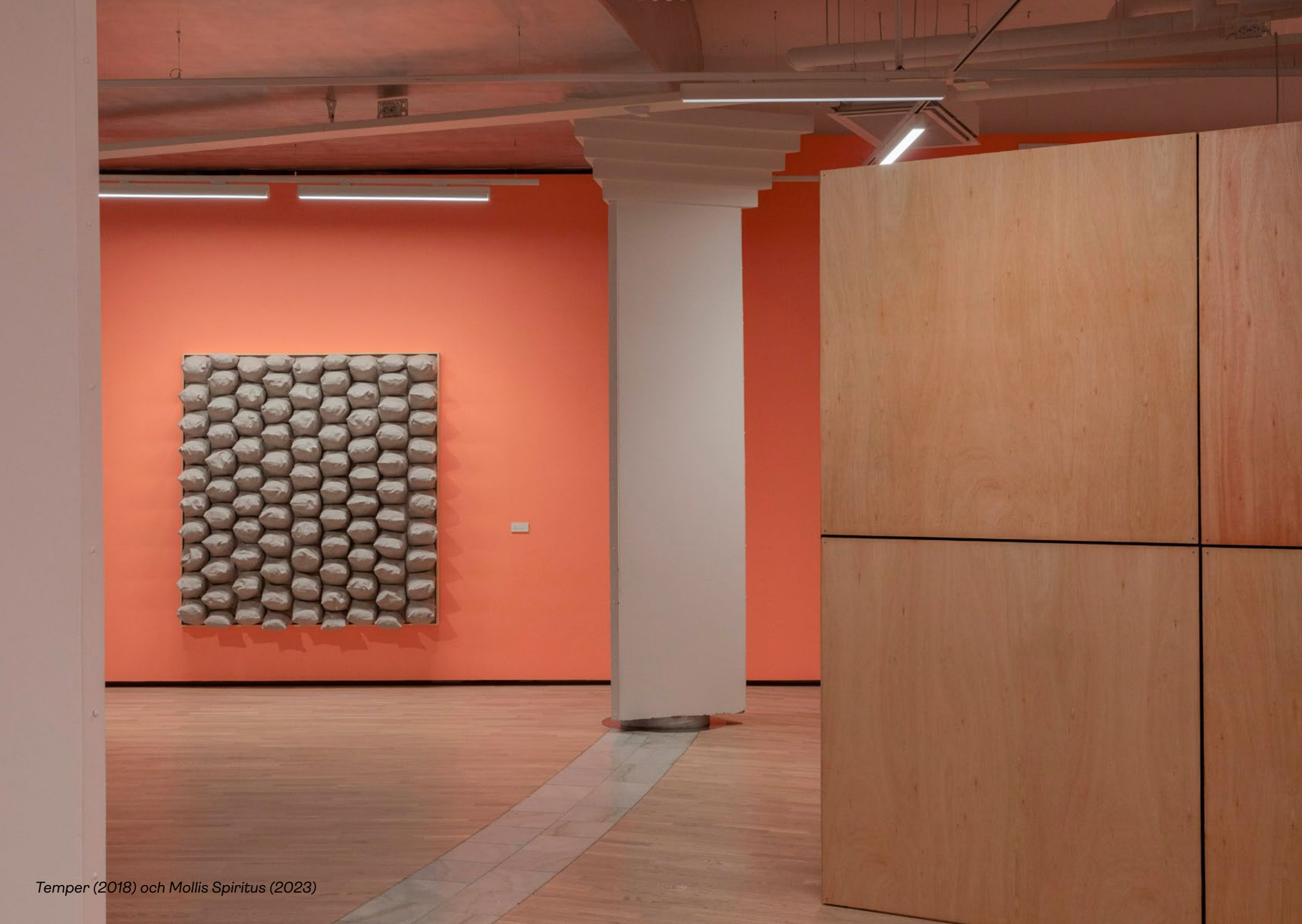
Temper (2018) och Mollis Spiritus (2023)