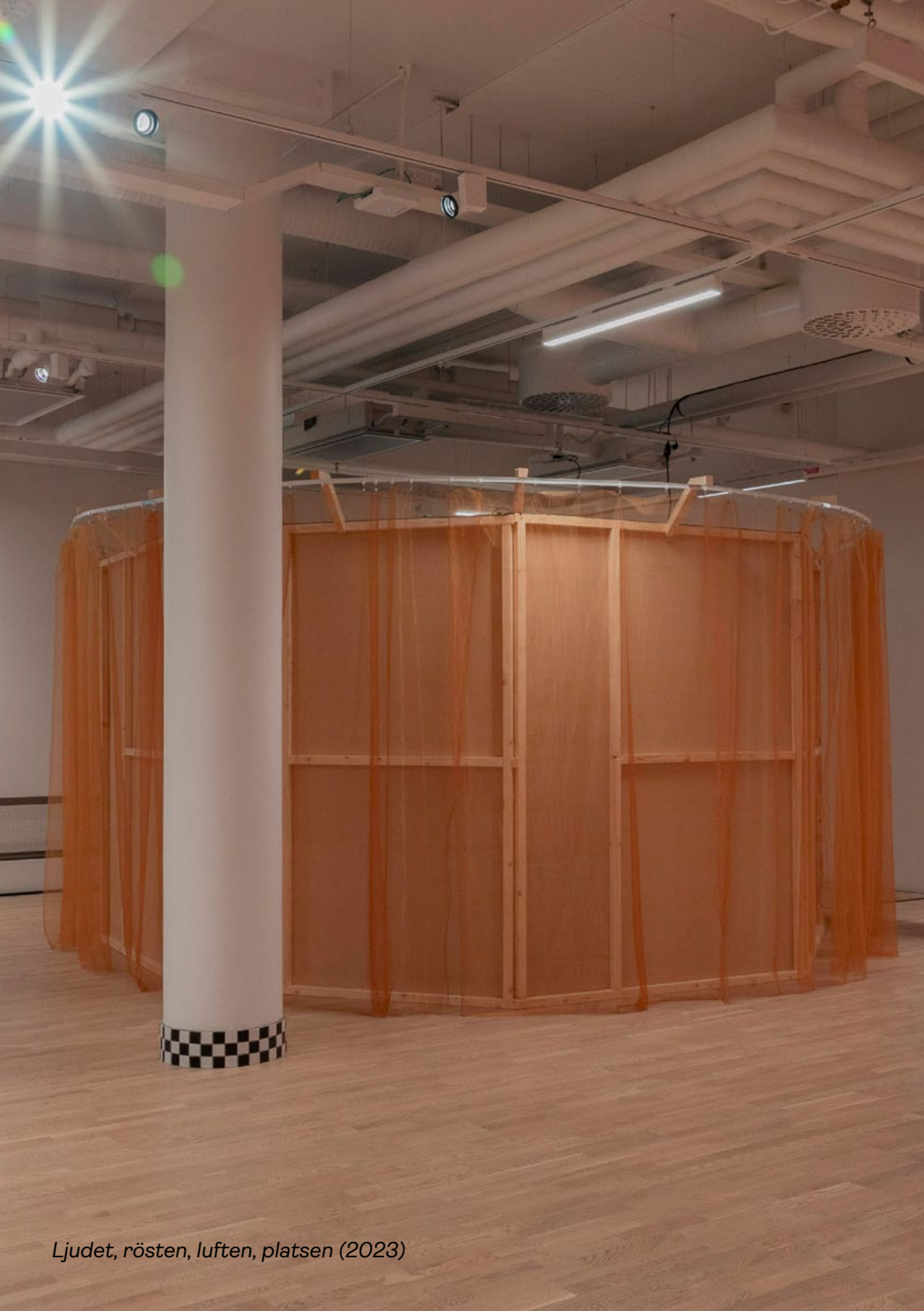
Ljudet, rösten, luften, platsen (2023)