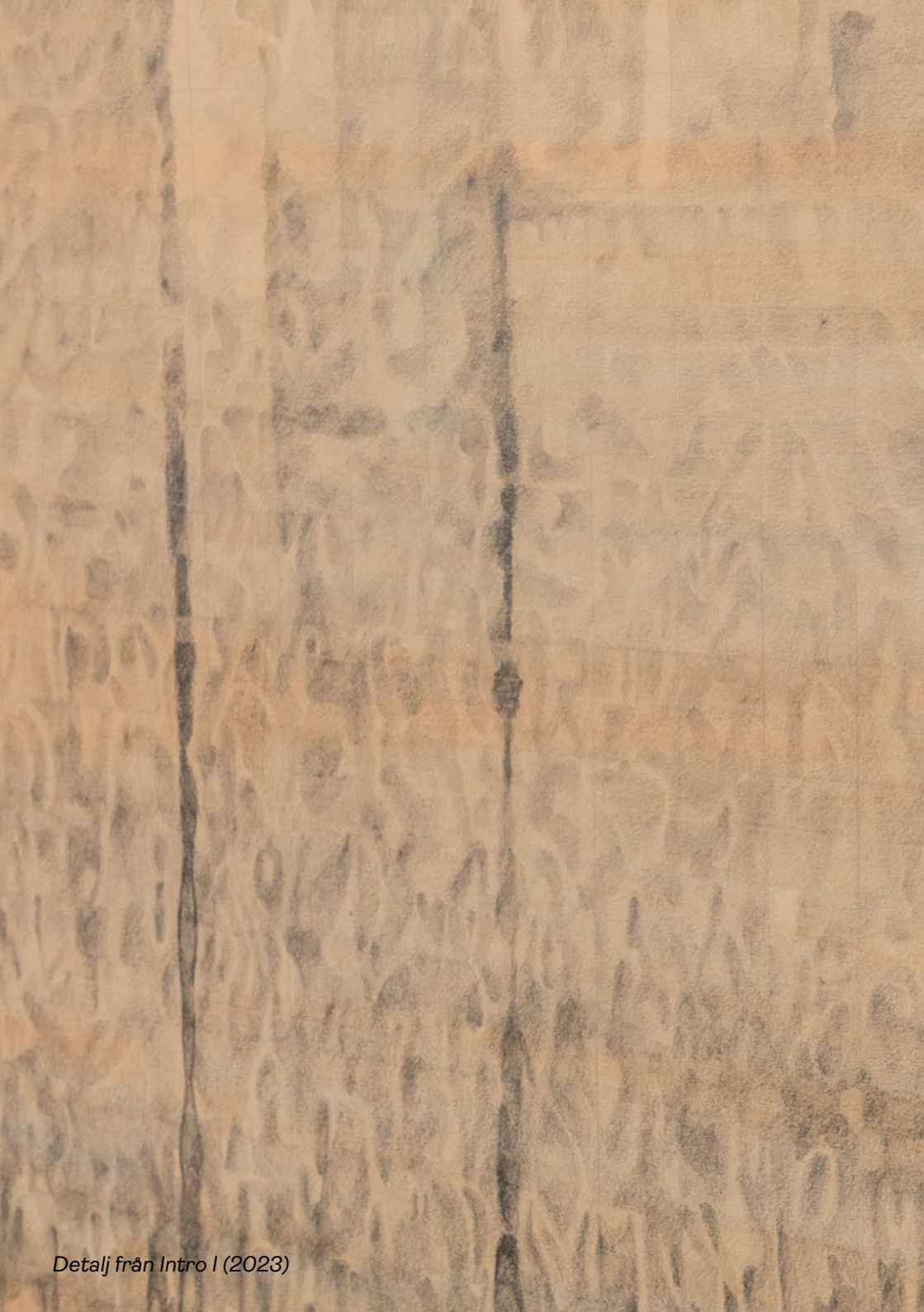
Detalj från Intro I (2023)

Den nedre delen av verket är istället tecknat efter ett spektrogram – en visualisering av ett ljud med tre dimensioner: ljudets frekvens vertikalt, tiden horisontellt och intensiteten i hur ljus eller mörkt bilden avtecknar sig.